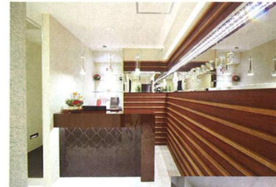
シックなカラーリングで統一されたサロンは、落ち着いた雰囲気でもリラックスできる空間。