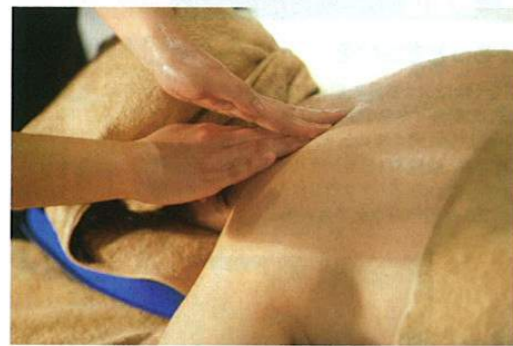
年齢からくる、いわゆる「〇〇肩」に悩まされている今日この頃。最初はガチガチでまったく動かなかった右肩が何度もセラピストの手に撫でられているうちに電流に反応するように。痛みもすこし和らいだ気がします。