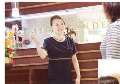
カウンセリングシートに記入をすると、その人に合わせた施術をセラピストがプログラムして気になる部分にアプローチ。

人間の身体にはとても微弱な電気が流れています。これが「生体電流」。脳波や心電図、体脂肪の計測などはこれを利用してのもです。その役割はとも重要で、脳や心臓を動かす、神経管の情報伝達を司る、血液やリンパの流れを促すなど生命活動に直結しています。