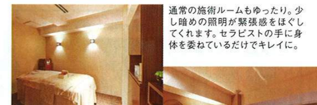
通常の施術ルームもゆったり。少し暗めの照明が緊張感をほぐしてくれます。セラピストの手に身体を委ねているだけでキレイに。

実際に施術を行なうセラピストはもちろん、スタッフ全員が丁寧に笑顔で対応。わからないことや不安に思うことも気軽に相談できます。