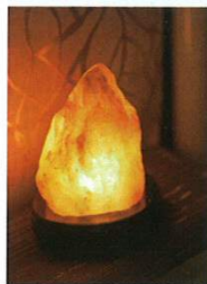
明かりを灯すとマイナスイオンを発生させる岩塩ランプ。まるで、滝などのある大自然の中にあるような清々しい気分。