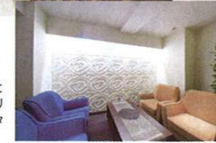
カウンセリングルームにはゆったりと心地いいソファが。事前のカウンセリングだけでなく、施術後のまったりタイムもここで。